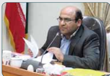
کیفیت و کمیت آموزش دامپزشکی فاجعه‌بار است

پیام نجفی مدیرکل امور اقتصادی دانش‌بنیان و سرمایه‌گذاری دانشگاه آزاد با اشاره به برگزاری فن بازارهای تخصصی در این دانشگاه از ۱۳ تا ۱۵ بهمن‌ماه، اظهار کرد: با توجه به تأکید محمدمهدی طهرانچی رئیس دانشگاه، مبنی بر حمایت از طرح‌های پژوهشی و دانش‌بنیان و تقویت بخش کشاورزی، برنامه‌ریزی‌ها برای برگزاری دومین فن بازار دانشگاه آزاد اسلامی در حوزه تولیدات کشاورزی و منابع طبیعی انجام شد.