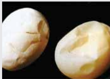
تخم‌مرغ‌های با پوسته ضعیف یا بدون پوسته (لمبه)

ترک‌هایی به سمت خارج نقطه مرکزی تخم‌مرغ که اغلب کمی تیز است و ۱ تا ۲ درصد کل تولید را شامل می‌شود.