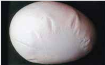
تخم‌مرغ‌های با سطح صاف

تخم‌گذاری‌های زود هنگام بیشتر است، اغلب نتیجه تخمک‌گذاری مضاعف است که یک تخم با پوسته کم و یکی دیگر با پوسته مضاعف تولید می‌کند.