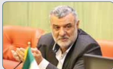
حجتی: ابزارهای مقابله با آفات گیاهی به‌روزرسانی شود

مدیرعامل شرکت آب منطقه‌ای استان مرکزی نیز گفت: فرونشست زمین در دشت اراک و در هزازه و میرآباد آغاز شده که به‌صورت شیاری بوده و شواهد آن در نزدیکی شهر اراک مشهود است.