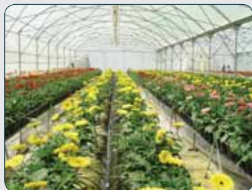
۵۰۰ هکتار گلخانه در گلستان احداث می‌شود

رئیس سازمان نظام‌مهندسی کشاورزی گفت: اکنون باید به‌عنوان سپاه دانش آماده‌به‌کار باشیم و هر جا که لازم شد، حضور پیدا کنیم.