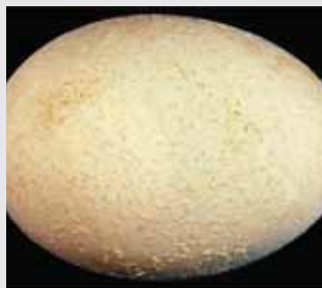
پوسته خشن و سمباده‌ای

این تخم‌مرغ‌ها ظاهر جالبی ندارند و به تخریب حساس‌اند. ایجاد این نوع تخم‌مرغ‌ها از ۵ تا ۶ درصد متفاوت است. معمولاً توسط پولت‌هایی که تازه شروع به تخم‌گذاری کردند و به ویژه در پرندگان که زود به سن بلوغ رسیده‌اند ایجاد می‌شود.