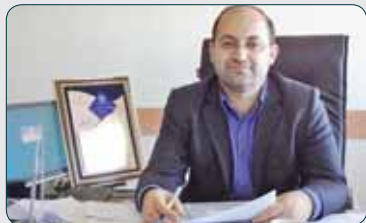
دومین فن بازار دانشگاه آزاد در حوزه کشاورزی برگزار می‌شود

در گنبد کاووس متقاضی وجود دارد که از این مقدار برای ۹۷ هکتار پروانه تأسیس صادر و عملیات احداث ۶ هکتار آن آغاز شده است. وی از فعال بودن پنج هکتار گلخانه تولید محصولات کشاورزی در گنبد کاووس نیز خبر داد و اظهار کرد: توسعه کشت‌های گلخانه‌ای سیاست جدید وزارت جهاد کشاورزی و گامی مؤثر در افزایش تولیدات این بخش است.