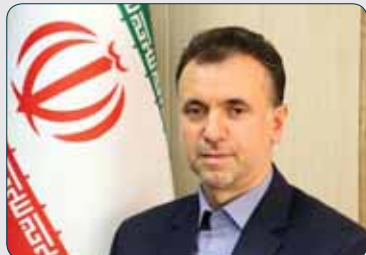
نقش «توان داخلی»

چندی پیش در اندونزی یک محموله قاچاق محصولات کشاورزی ضبط شد که در حمایت از تولید داخلی آن را با شناورش به آتش کشیدند، بنابراین ما نیز باید مجوزهای لازم را برای آتش زدن محصولات کشاورزی قاچاق صادر کنیم.