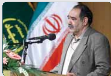
تأکید معاون وزیر کشاورزی بر ارائه سموم با نسخه

وزیر جهاد کشاورزی به گسترش مبادلات گیاهی و در پی آن تنوع و افزایش بیماری‌ها و آفات نباتی نسبت به گذشته اشاره کرد و اظهار داشت: بعید است ضایعه گیاهی وجود داشته باشد که در دنیا روشی برای مقابله با آن وجود نداشته باشد بنابراین در قرنطینه گیاهی باید به روش‌ها و ابزار روز مجهز شویم و نسبت به شناسایی آفات و همچنین روش‌های مقابله با بیماری‌های گیاهی با همکاری و بهره‌گیری از دانش و تجارب دانشمندان و موسسه‌های بین‌المللی اقدام کنیم. وی با اشاره به اینکه اکنون بحث قرنطینه گیاهی در تولید بذور در حال انجام است، تصریح کرد: این مهم در حوزه مقابله با آفات گیاهی هم باید انجام شود.