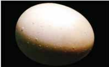
تخم‌مرغ‌های جوش‌دار (pimples)

به تخم‌مرغ‌هایی گفته می‌شود که قسمتی از پوسته صاف یا ضخیم شده است. اغلب قسمت مجاور پوسته چروکیده است. این تخم‌مرغ‌ها کمتر از ۱ درصد کل تولید را شامل می‌شوند. این‌گونه تخم‌مرغ‌ها اغلب توسط پولت‌ها در تخم‌گذاری اولیه به وجود می‌آید و ممکن است نتیجه تخمک‌گذاری مضاعف باشد و یا اینکه در غدد پوسته ساز یک روز بیشتر مانده باشد.